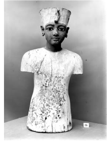
Estatua de madera de Tutankhamón

Reyes, en la Ciudad de los Muertos (necrópolis) en la orilla occidental del Nilo, en frente de Tebas, se convirtió en el lugar de enterramiento central de casi todos los reyes del Reino Nuevo. Famosos faraones como Hatshepsut, que hizo inmortalizar en su templo funerario tebano su expedición comercial al lejano país de Opone (Punt), el gran estratega bélico Tutmosis III y el faraón Amenofis III, el abuelo de Tutankhamón, van a marcar de forma determinante la dinastía XVIII.