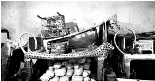
Imagen de la cama ritual de la antecámara

El material escolar está enfocado en los objetos presentados en la exposición. Todas las piezas de la exposición son copias exactas del tesoro de Tutankhamón, realizadas por diversos artistas egipcios en un laborioso trabajo de artesanía al que han dedicado numerosos años. De esta manera se han creado objetos únicos que hacen posible reconstruir la situación exacta de la tumba en el momento en que Howard Carter la descubrió en el año 1922. Mediante el ajuar funerario pueden representarse de forma especialmente clara numerosos aspectos de la vida del Antiguo Egipto y del reinado de los faraones.