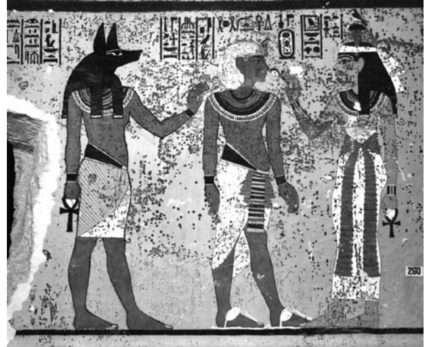
Fresco de la pared sur de la cámara funeraria. Tutankhamón, seguido por el dios Anubis a la izquierda, recibe de la mano de la diosa Hathor el símbolo de la "vida".

Entre los últimos faraones de las dinastías XVIII cuentan el sacerdote Ay y el general Horemheb. Bajo el reinado de Horemheb y sus sucesores se destruyeron muchos de los monumentos y es-