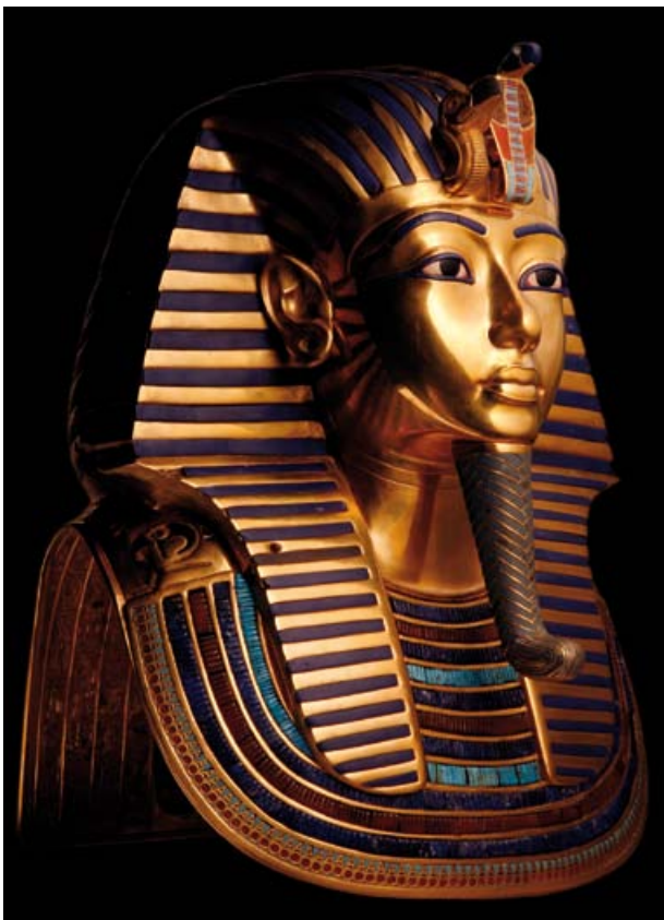
Máscara de Tutankhamón

Tutankhamón gobernó durante el Reino Nuevo (dinastías XVIII a XX, alrededor de 1550 hasta 1070 antes de Cristo). La dinastía XVIII comenzó con Amosis, que acabó con el reinado de los hicsos en Egipto. Los hicsos provenían del Oriente Próximo y dominaron Egipto desde el Delta. Amosis expulsó a los hicsos de Egipto y sus sucesores reconquistaron otras zonas como Nubia. Egipto se convirtió en una potencia mundial y Tebas, la actual Luxor, en residencia de los faraones. El reinado se prolongaba a lo largo del Nilo desde el Mediterráneo hasta Nubia y llegaba hasta Mesopotamia. El Valle de los