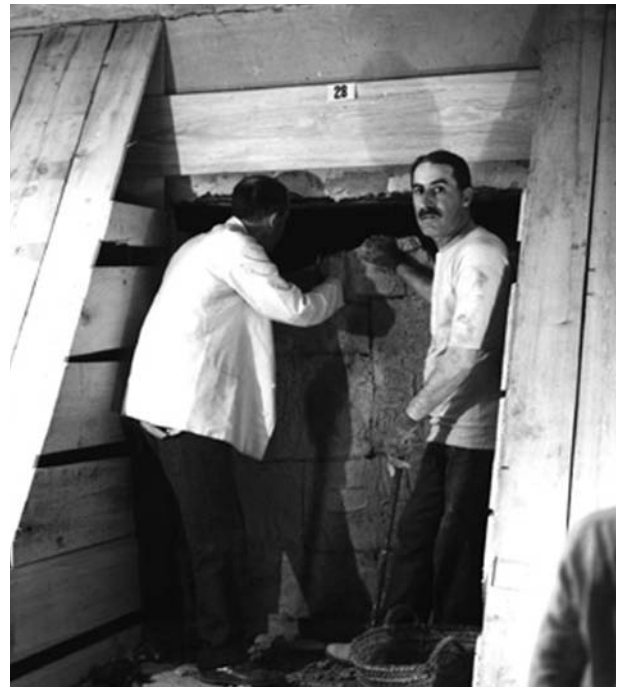
Howard Carter durante los trabajos en la cámara funeraria

En 1799 durante la construcción de la fortaleza de Rosetta (en árabe Raschid) se encontró la famosa piedra de Rosetta. El texto de este importante hallazgo, del cual se muestra una copia al comenzar