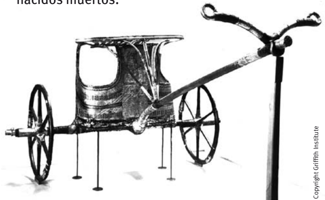
Carro de combate

Para su resurrección en el Más Allá se van a depositar en la tumba diversas estatuas de divinidades para el faraón. En otro módulo se muestran copias exactas de estas figuras. La exposición presenta 25 copias de los uschebtis, que debían de ser los servidores de Tutankhamón en el Más Allá. La tumba de Tutankhamón contenía también dos pequeños sarcófagos con momias de niños recién nacidos muertos.